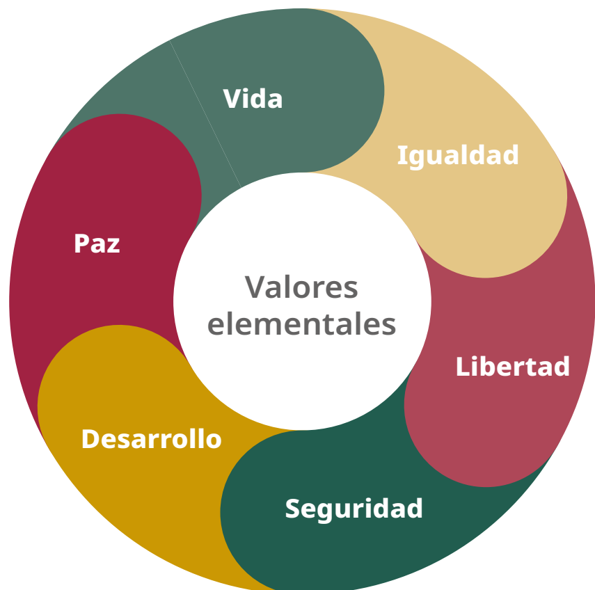
Gráfico 2. ¿Qué valores emanan de los derechos humanos?

Para su análisis y revisión, es posible identificar las nociones relacionales a partir de los elementos y la caja de herramientas de las Ciencias Sociales. En este sentido, tres matrices analíticas resultan útiles para acercarse a la noción de derechos humanos, comprender sus características y elementos, y enriquecer el abordaje de este concepto. Estas se presentan en los gráficos 2, 3 y 4.