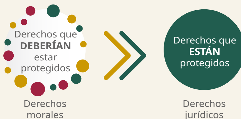
Gráfico 5. Naturaleza de los derechos humanos desde la práctica jurídica

En este marco problematizador, la persona docente también puede abrir la reflexión y, al ofrecer una perspectiva diferente, plantear la necesidad de clarificar si la expresión “derechos humanos” se refiere a derechos jurídicos o a los llamados “derechos” morales. Es fundamental distinguir si hablamos de pretensiones de las personas que efectivamente están protegidas por las leyes del país o de aquellas que deberían estarlo (Gaspar, 2004), ver gráfico 5.