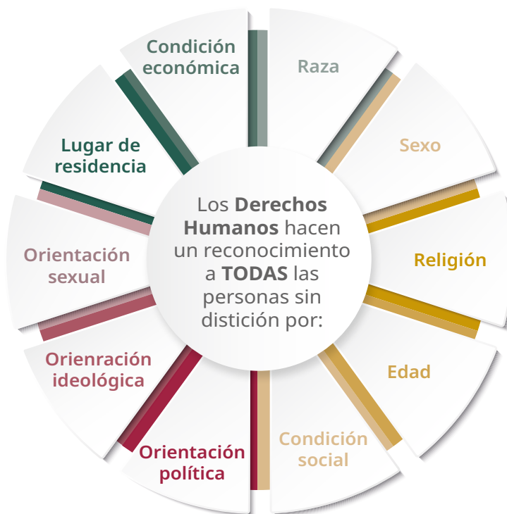
Gráfico 3. Elementos detonantes de discriminación bajo la noción de universalidad de los Derechos Humanos