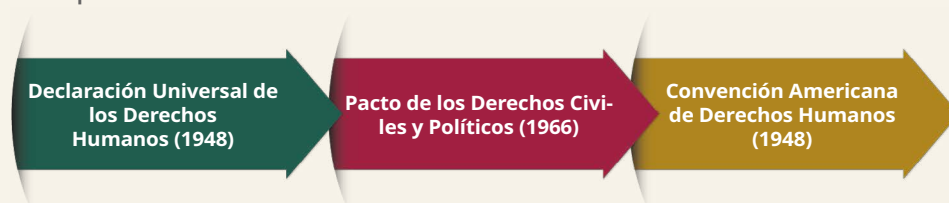
Gráfico 6. Tratados internacionales de los cuales México es Estado parte

Es importante considerar tres de los principales acuerdos internacionales de los cuales México es Estado parte (ver gráfico 6).