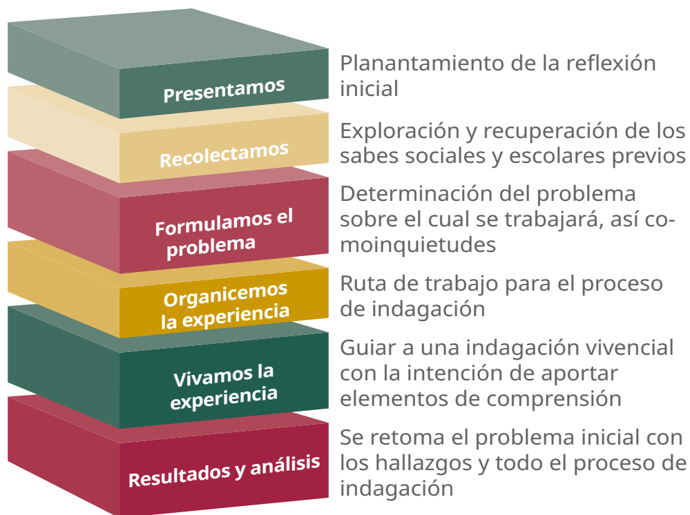
Gráfico 1. Metodología: Aprendizaje Basado en Problemas

Las fases, pasos o etapas de esta metodología se describen en el gráfico 1.