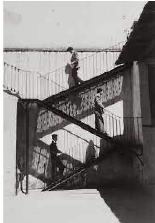
(Social, s. f.)

La fotografía que se presenta a continuación es obra de la fotógrafa mexicana Lola Álvarez Bravo y se titula: “Unos suben, otros bajan”. Obsérvala con cuidado y pon atención en las ideas y emociones que te despierta. Mira las formas, los contrastes de luz y sombras, así como todos los elementos que llamen tu atención.