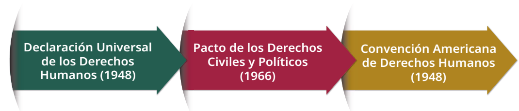
Gráfico 1. Tratados internacionales de los que México es Estado parte

Esta reforma constitucional transformó la manera en que se organiza el sistema jurídico, pues implicó que todos los tratados internacionales en materia de derechos humanos que México ha suscrito (ver gráfico 1) tengan el mismo nivel de validez que la Constitución Política de nuestro país.