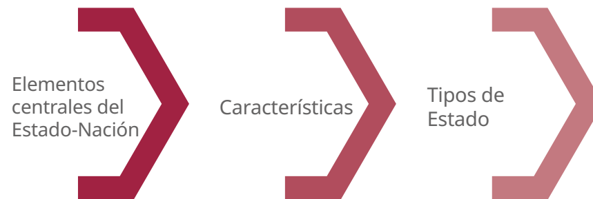
Gráfico 2. Componentes de la noción de Estado para la problematización

Estos elementos constituyen piezas indispensables que pueden servir para investigar, debatir y problematizar las nociones sobre el Estado-nación y sus conexiones (ver gráfico 2).